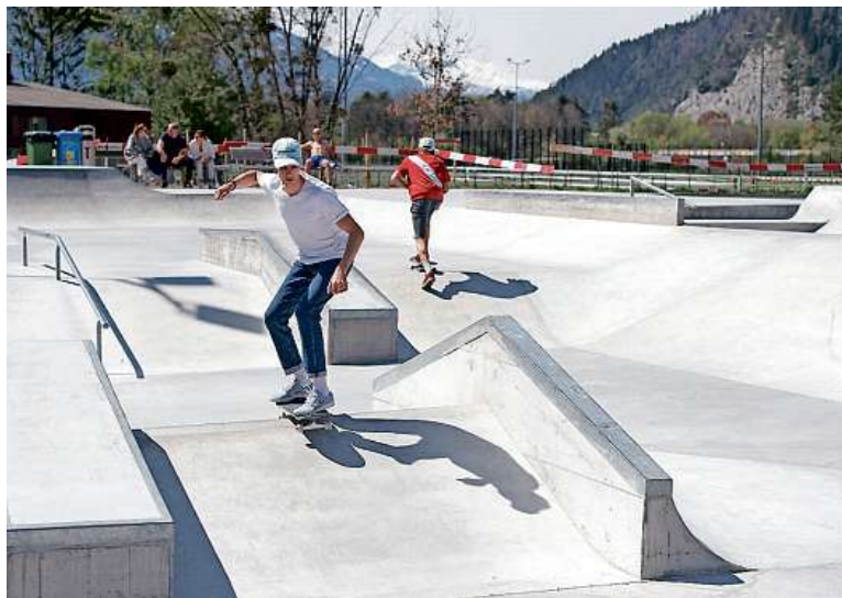
Abstand auch beim Sport gehalten: Im «Betongarta» in der Oberen Au in Chur genossen diese Skater das Frühlingswetter.